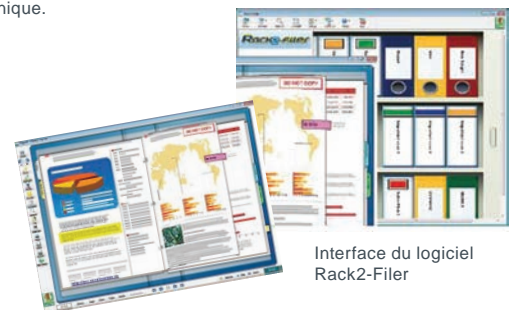
Interface du logiciel Rack2-File

La version de luxe du ScanSnap S1300 est dotée du logiciel Rack2-File qui offre l'aspect et la convivialité de documents papier dans un environnement électronique.