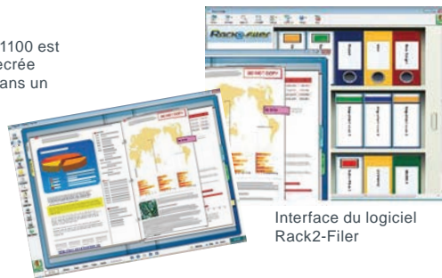
Interface du logiciel Rack2-Fileur

La version de luxe du ScanSnap S1100 est dotée du logiciel Rack2-Fileur qui recrée l'organisation de dossiers papier dans un environnement électronique.